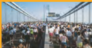
SANACE A OCHRANA BETONU