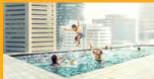
LEPENÍ A TMELENÍ